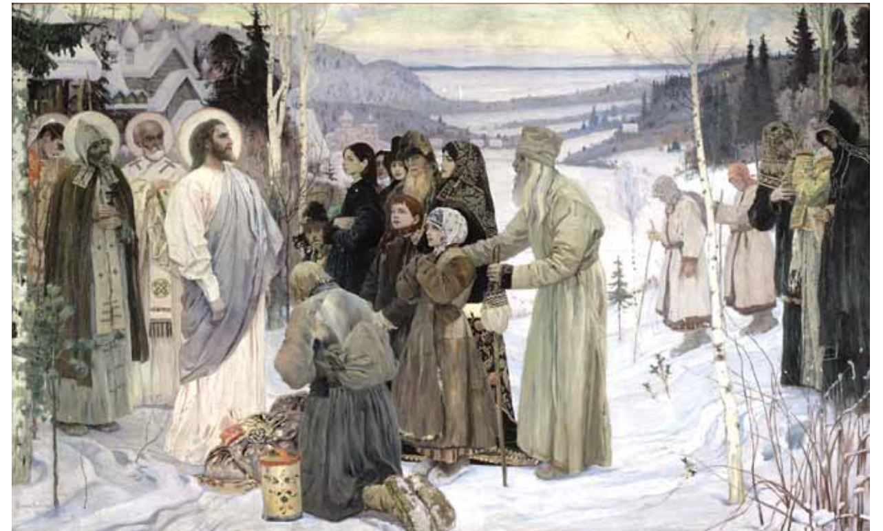
М.В. Нестеров. Святая Русь. 1901–1905. Холст, масло. 233x375. Государственный Русский музей. Санкт-Петербург