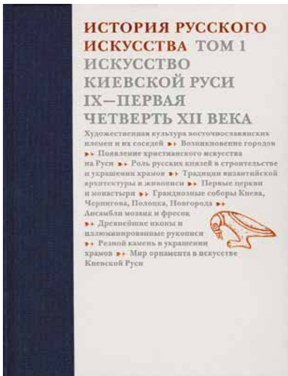
Обложка первого тома «Истории русского искусства»

мне интересно, как он отзовется на мои тревожные ожидания.